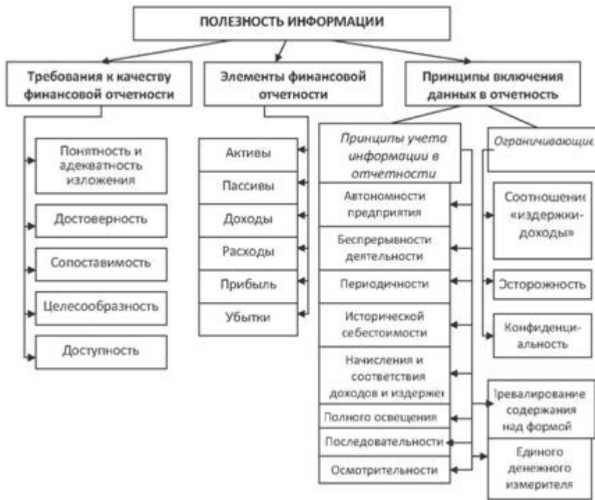
Рисунок 2 – Характеристики финансовой отчетности

Выделяют следующие качественные характеристики финансовой отчетности: